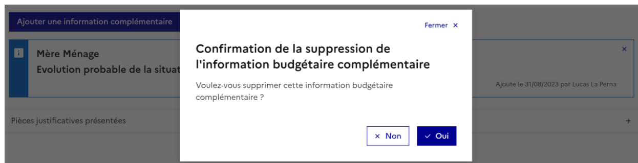
Figure 8 - Confirmation de suppression d'information complémentaire