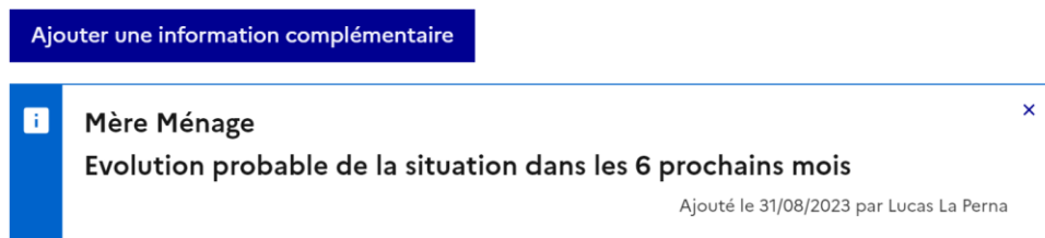
Figure 6 - Affichage d'une information budgétaire complémentaire

Ticket 4210 : Ajouter une information budgétaire complémentaire